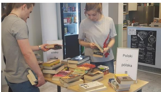
Flott framtak og skemmtileg stund á bókasafninu!