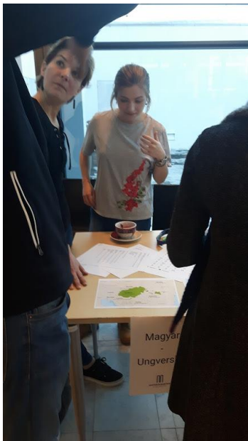
Ungverska er tungumál sem við sjáum ekki oft skrifað, né heyrum talað.