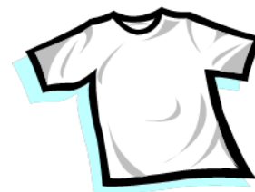
Bolur - koszulka