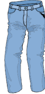
Buxur - بنطلون