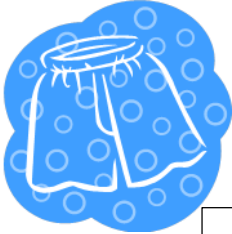
Stuttbuxur - شترات