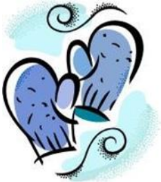
Vetlingar - قفازات