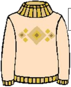
Peysa - بلوزة / كنزة