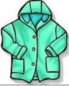
Úlpa - معطف