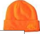
Húfa - قبعة