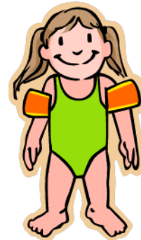
Sundföt - ثوب / ملابس السباحة