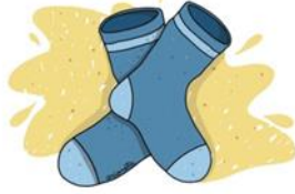
Sokkar - جوارب