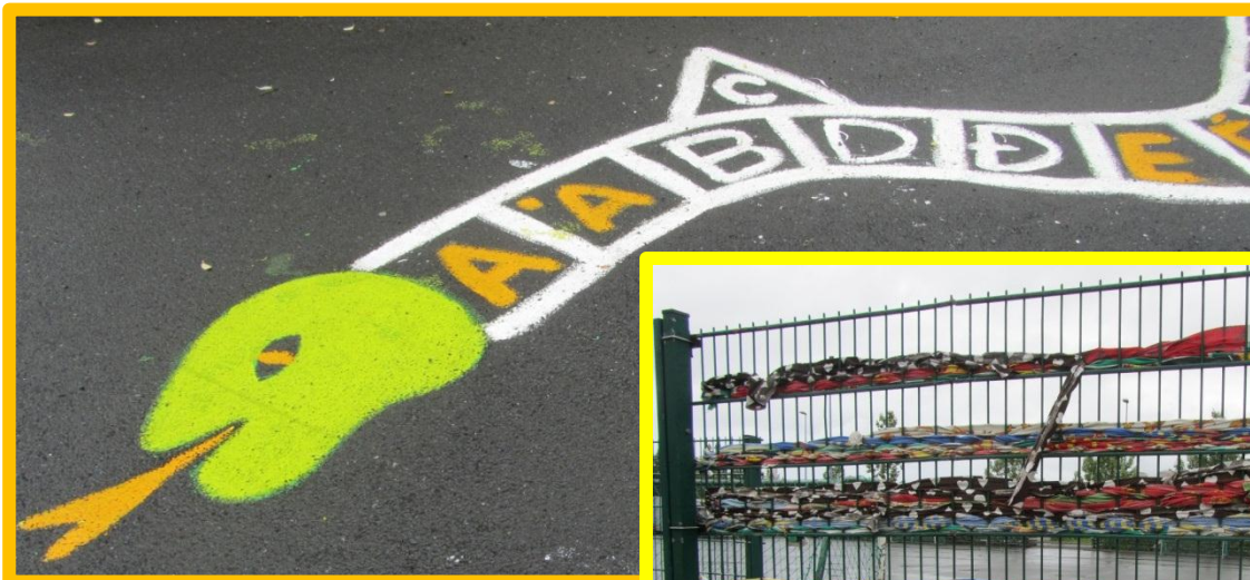
Skólalóð Snælandsskóla, sumar 2014

Í sumar var ég á göngu um Fossvogsdalinn og fram hjá Snælandsskóla. Þar tók ég mynd af tveimur skemmtilegum hugmyndum – stórum „stafrófsdreka“ þar sem sérhljóðarnir voru málaðir gulir en samhljóðarnir hvítir og erlendir stafir mynduðu gaddana sem stóðu út úr drekanum. Girðingin kringum skólalóðina var líka skrautleg þar sem nemendur voru búnir að „vefa“ í hana með marglitum renningum. Þetta setti líflegan og skemmtilegan svip á umhverfið og er ef til vill hugmynd að útivinnu fyrir einhverja!